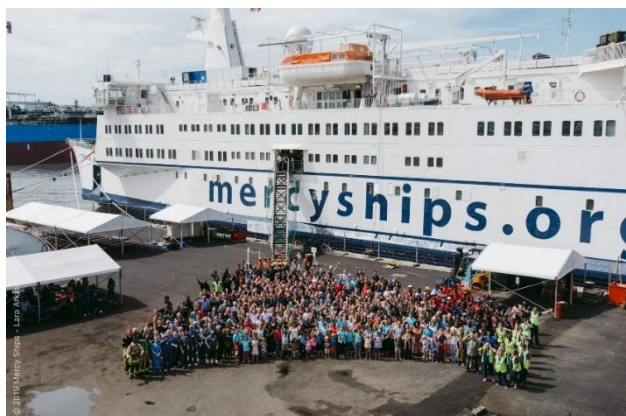
Le navire Africa Mercy actuellement au Sénégal pour soutenir les services de santé

Pendant leurs visites au Bénin et au Cameroun, le personnel des Mercy Ships a été témoin d'une