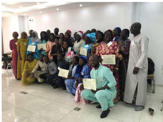
Les participants après avoir complété les cinq jours de la formation

La formation continue cette semaine avec dix participants qui ont été soigneusement sélectionnés de la cohorte de la semaine dernière. La formation de cette semaine a pour but la responsabilisation des professionnels de la santé des compétences à former les autres. On espère qu'à la fin de la formation, ces professionnels de la santé auront acquis les connaissances de base en Soins Palliatifs pour qu'ils puissent faire de la sensibilisation et du plaidoyer pour l'accès amélioré aux soins palliatifs et pour l'accès aux médicaments essentiels, surtout la morphine liquide orale.